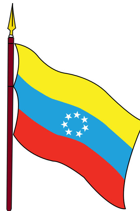
BANDERA DECRETADA POR EL GENERAL CIPRIANO CASTRO

Revolución restauradora. La bandera nacional, símbolo de la patria, es la adoptada por las siete provincias que formando la Confederación Americana de Venezuela se declararon libres e independientes el 5 de julio de 1811, cuyos colores son: amarillo, azul y rojo en listas iguales horizontales, en el orden que queda expresado, de superior a inferior, llevando en medio de la lista azul, siete estrellas en circunferencia, como recuerdo de las mencionadas provincias.