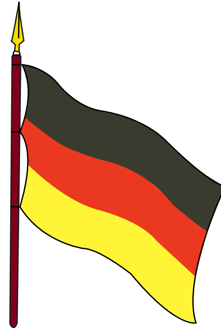
BANDERA DE MIRANDA PROYECTO DEL EJÉRCITO COLUMBIANO 1800

Presenta tres franjas paralelas e iguales, con los colores negro, encarnado y amarillo, los cuales representan las razas de negros, pardos e indios, sobre cuya igualdad habría de estructurarse el ejército del Generalísimo.