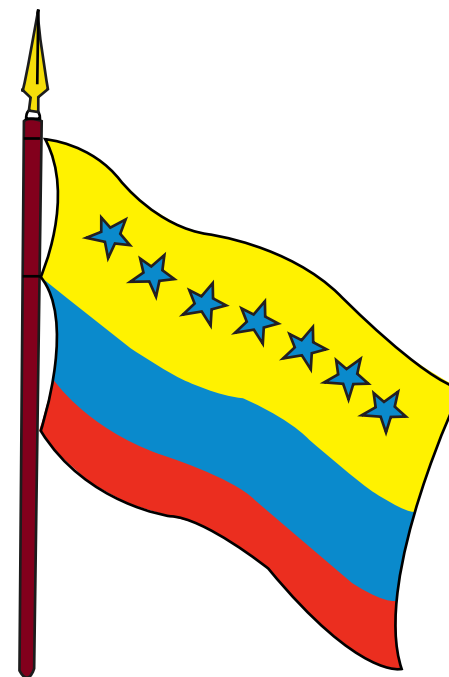
BANDERA DEL GOBIERNO FEDERAL PAMPATAR, 12 DE MAYO DE 1817

En decreto del 17 del mismo mes, se establece el nuevo tricolor patrio, a ser usado en los buques de guerra de la república: se conservan de la misma forma las franjas amarillo, azul y rojo, pero colocando siete estrellas azules en el campo amarillo, las cuales representan las provincias unidas de Caracas, Cumaná, Barinas, Barcelona, Margarita, Mérida y Trujillo, integrantes de la Confederación Venezolana al momento de la firma del Acta de nuestra Independencia.