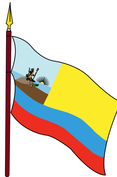
BANDERA DE LA INDIA

La utopía de Colombia la Grande apareció en este pabellón que sería bautizado con sangre en los encarnizados combates de la Primera República.